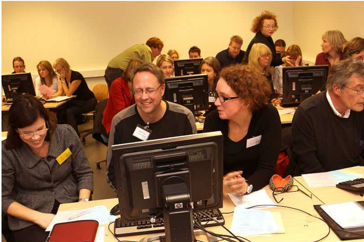
De praktiska övningarna under onsdagen var mycket uppskattade