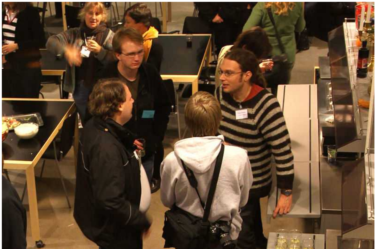
Mingel efter onsdagens övningar

Totalt sätt är Wikimedia Sverige mycket nöjda över insatsen och effekten och ser detta seminarium som kanske det mest värdefulla föreningen åstadkommit under året, även i konkurrens med många andra bra insatser som gjorts